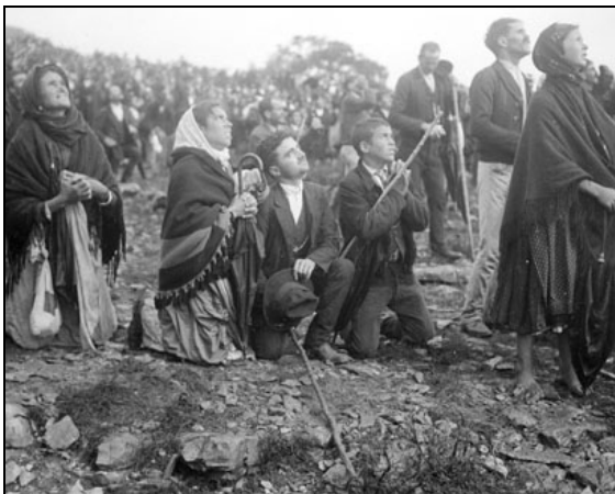
Il miracolo del sole: 13 ottobre 1917

Tale segno si verificò puntualmente, quando la visione giunse al termine.