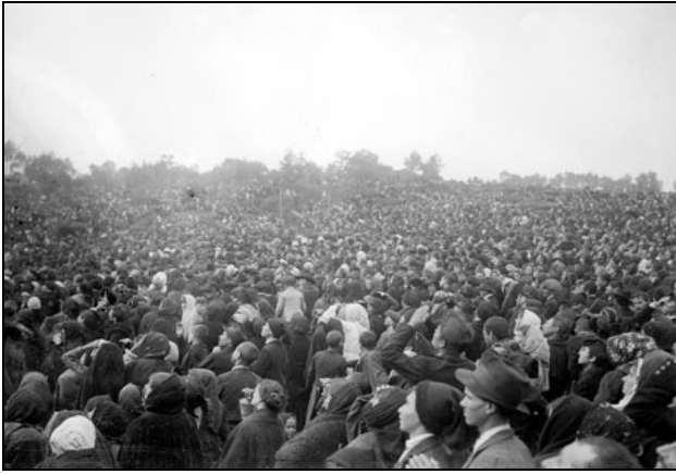
L'immensa folla, circa 70.000 persone assistono al miracolo del sole il 13 ottobre 1917

stenza stessa del nostro sistema. Un minimo spostamento del sole sarebbe causa di ineluttabili conseguenze apocalittiche. Infatti, i pianeti orbitanti intorno ad un centro improvvisamente venuto a mancare, crollerebbero in un attimo, come un castello di carte. Eppure, a Fatima, il 13 ottobre 1917, si verificò proprio questo fatto, per la scienza del tutto inconcepibile.